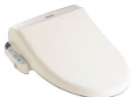
PF パステルアイボリー